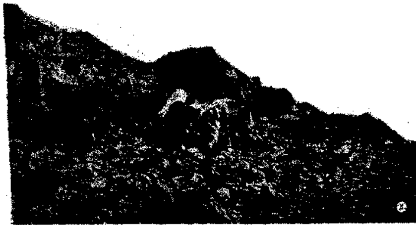
المؤلف يتسلق إحدى هضاب جبل أحد أثناء تجواله حول مواقع المعركة